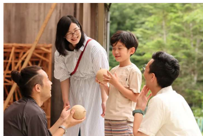
花火職人体験（豊田煙火）