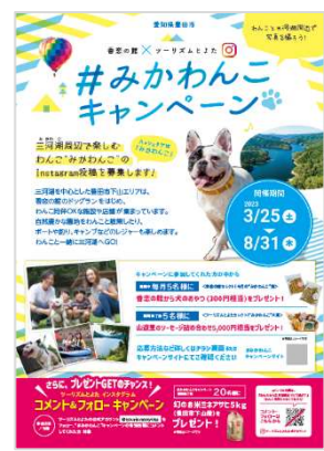
各種観光パンフレット（とよたび気分ほか）