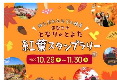
デジタルスタンプラリーの例