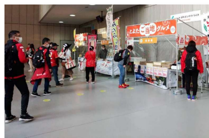
とよたご当地グルメブース