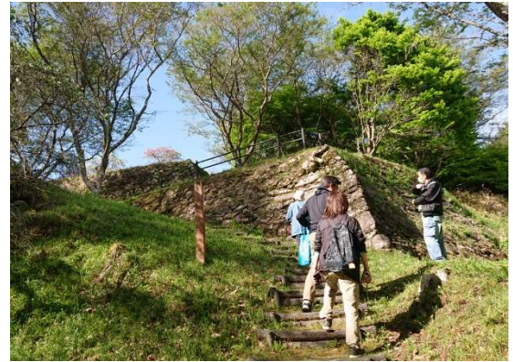
三河を守る家康防御の城めぐりガイドツアー