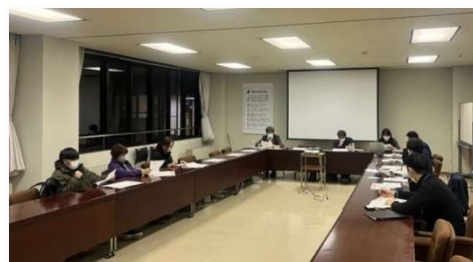
マーケティング調査結果の地区報告会