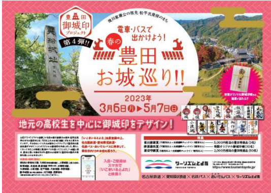
電車・バスで出かけよう！豊田お城巡り！！