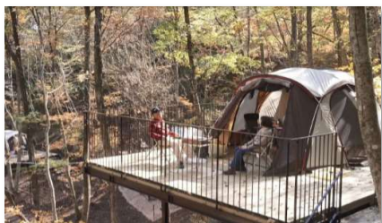
少し贅沢なキャンププラン