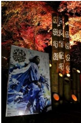
松平郷天下泰平の竹あかり