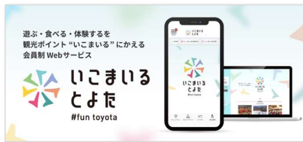
「いこまいる とよた」の紹介バナー