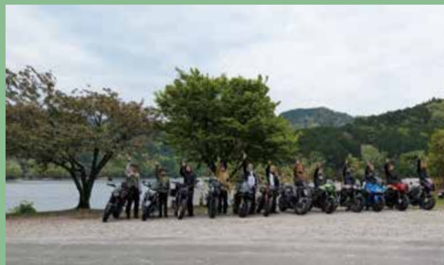
三河湖モニュメントはライダーに人気のフォトスポット。