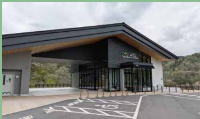
三河湖を眺めながら三河湖テラス「こりん」でひと休み。