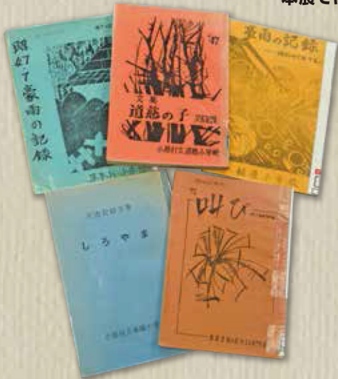
47豪雨の時に子どもたちが書いた文集 (豊田中央図書館蔵)

本展では、47豪雨の被害を写真で振り返るとともに、近年進められている災害への 備えについて紹介します。