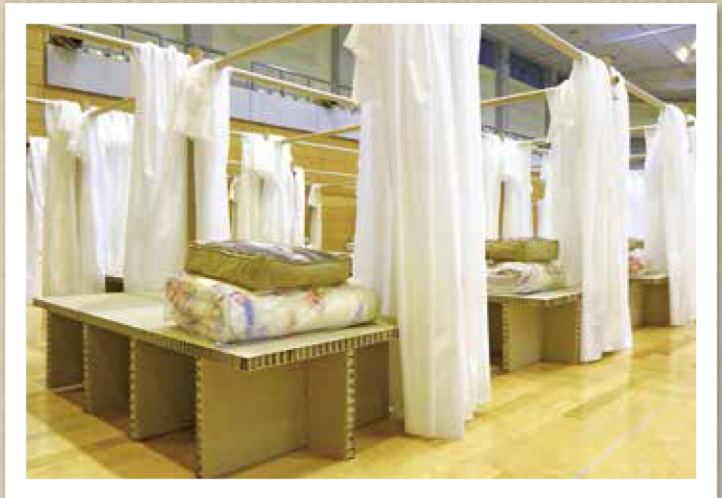
避難所用間仕切りシステム (坂茂建築設計+ボランタリー・アーキテツ・ネットワーク)