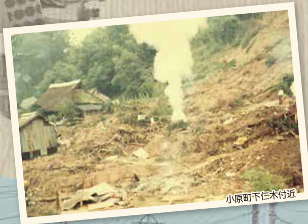
小原町下仁木付近