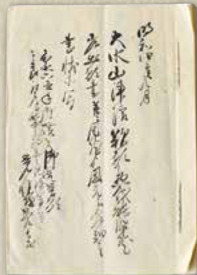
大水山津浪歎願惣代龍性院差出願書 (個人蔵)