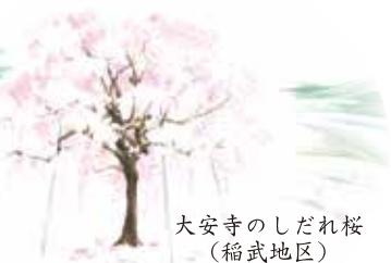
大安寺のしだれ桜 (稲武地区)