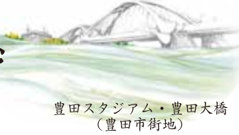
豊田スタジアム・豊田大橋 (豊田市街地)